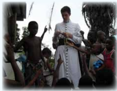
Distribution de chapelets pour les enfants des quartiers pauvres.