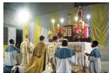
Salut solennel du Très Saint Sacrement.