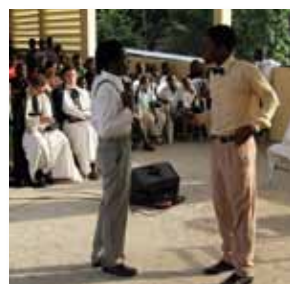
Scène du spectacle des enfants.

Puisse la piété de ces enfants enflammer les cœurs des plus grands !