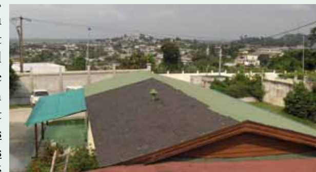
Le toit partiellement réparé de l'ancien garage, ainsi que les prolongements que nous avons du installer pour éviter les infiltrations.