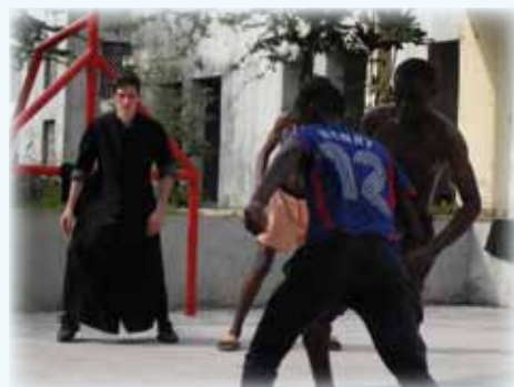
Moments de détente sur le nouveau terrain de sport.