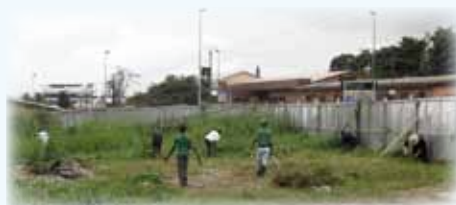
Entretien de la propriété avec l'aide de nos paroissiens.

Que Notre-Dame de Lourdes veille sur ses enfants, et que son manteau étoilé continue à nous couvrir de grâces !