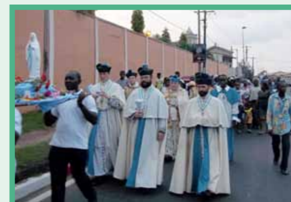
25 mars 2017 : Procession mariale présidée par Monseigneur Wach, Prieur Général.