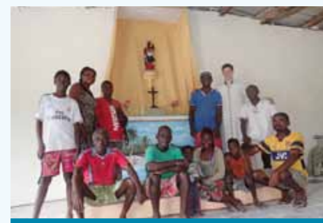
Les artisans d'un jour autour de l'autel terminé