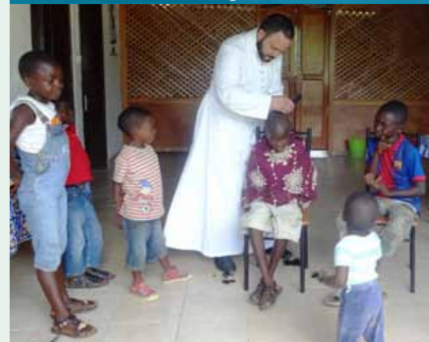
C'est le jour du coiffeur !