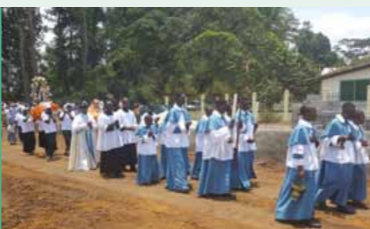
Procession avec la relique