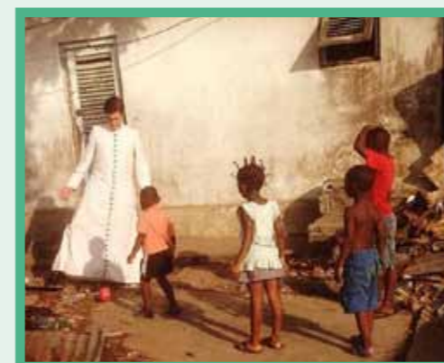
Pendant une visite du quartier, le Curé en profite pour faire une partie de football avec les enfants !