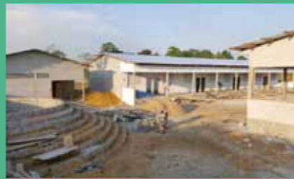
28 septembre : un peu de nettoyage