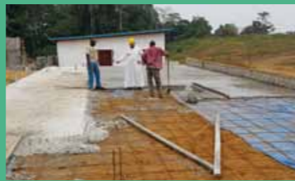
28 juillet : coulage de la dalle