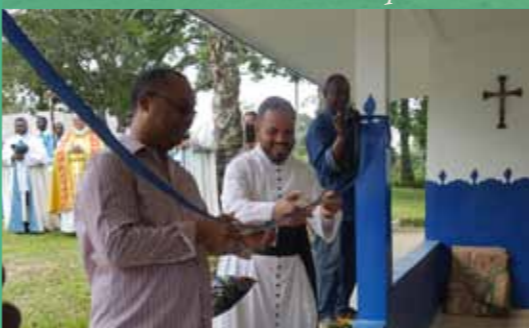
Inauguration du dispensaire