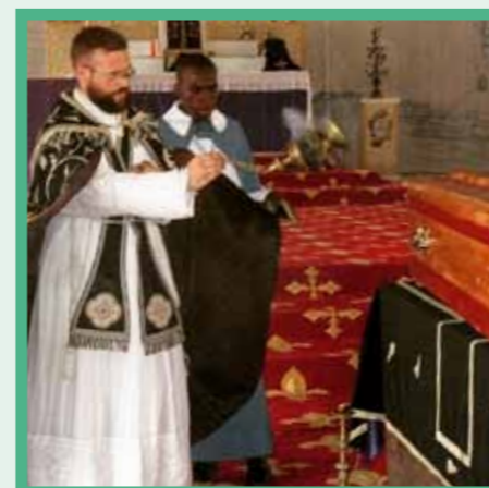
Enterrement à Libreville