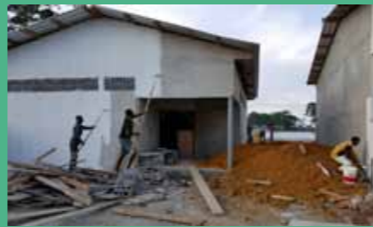
28 septembre : et enfin la peinture !