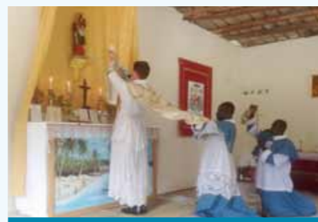
Messe de Noël