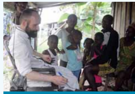
À Atondi Simba : recensement des enfants à baptiser.