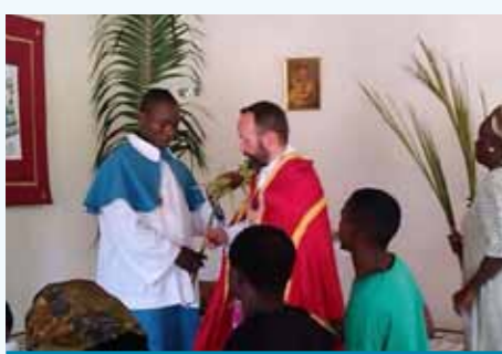
Dimanche des Rameaux à la Pointe-Denis

À la Pointe-Denis, grâce à votre aide, la chapelle a beaucoup avancé et de belles cérémonies ont déjà pu y avoir lieu ! Le chanoine Marc Téquy y célèbre maintenant la Messe tous les quinze jours. Dédicée à Notre-Dame de Bonne Délivrance, la statue de sa sainte patronne trône au-dessus du nouvel autel. L'antependium, peint par un artiste local, représente la Vierge couvrant la Pointe et ses habitants de son manteau : belle image qui parle à nos paroissiens.