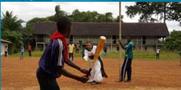
Partie de baseball pendant la colonie de garçons