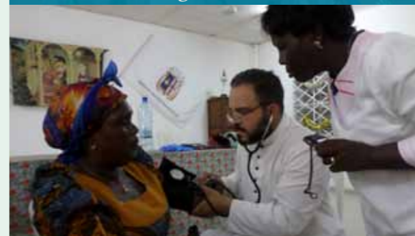
Formation aux premiers soins