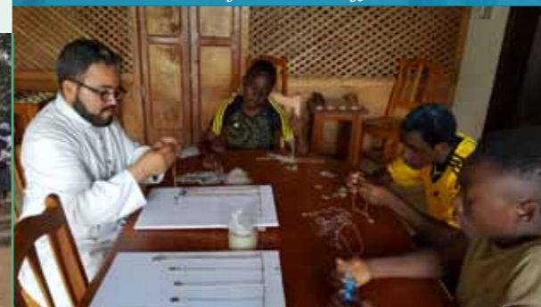
Préparation des médailles miraculeuses