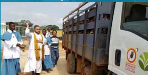
Bénédiction des locaux et des véhicules de l'entreprise Olam