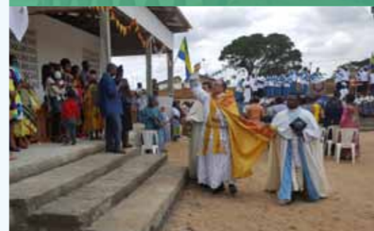
Aspersion des bâtiments