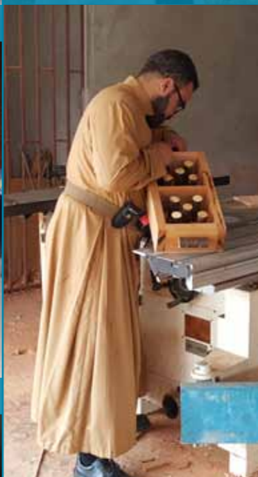
L'atelier de menuiserie