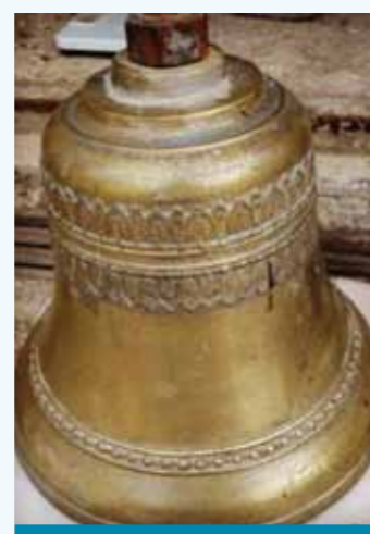
La cloche !

La cloche de l'église, qui pèse 30 kg, est déjà achetée... reste à la faire venir... et à construire le clocher !