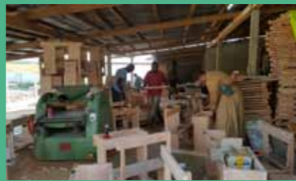
27 septembre : les derniers bureaux