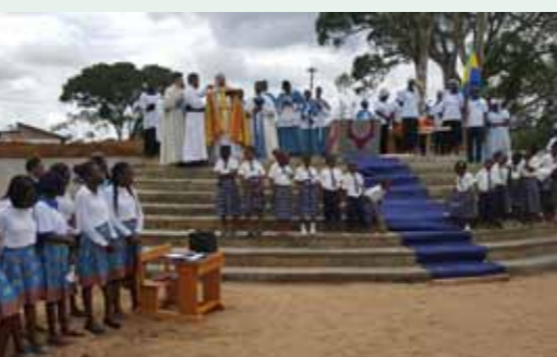
Bénédiction de l'École