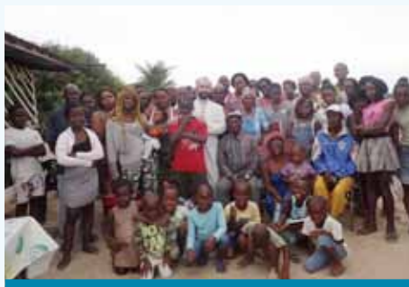
À Nyonié : sortie de la Messe de l'Assomption.