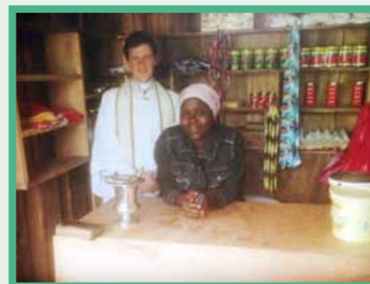
La boutique de Maman Euphrasie, construite par la paroisse et bénie par le Curé le jour de l'ouverture