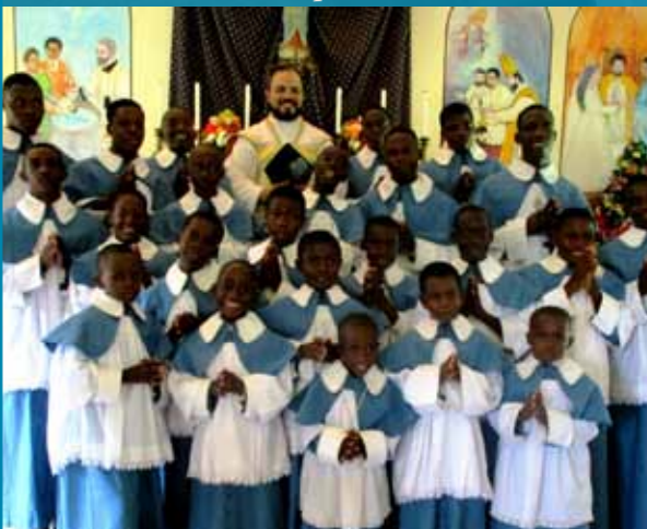
Les enfants de chœur ne manquent pas !