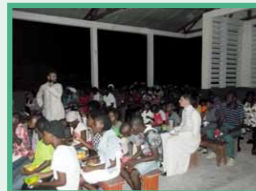
Salle comble pour le cinéma paroissial !