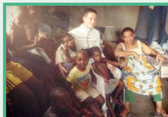
Fauteuil roulant offert par la paroisse à Maman Pélagie