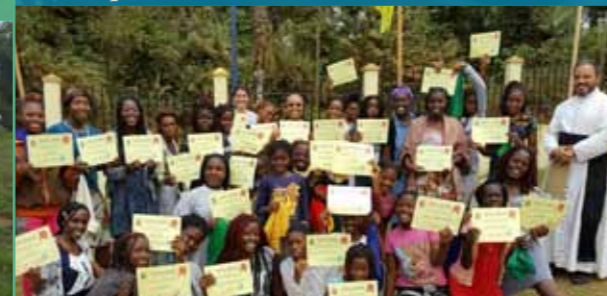
Remise des diplômes à la fin de la colonie de filles