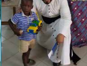
Noël des enfants