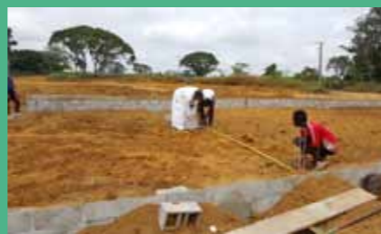
24 juin : tracé des cloisons