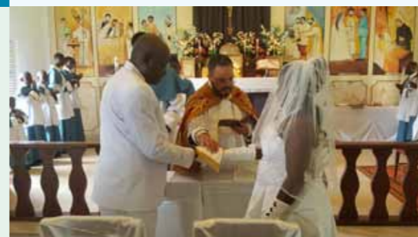
Mariage à la Mission