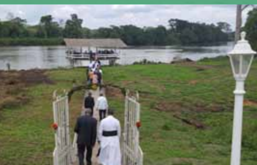
Réception sur la terrasse