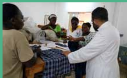
10 juillet : confection des uniformes