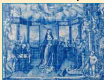
Modèle d' azulejos

Chers amis, il n'est pas trop tard pour apporter votre pierre à l'édifice. Aidez-nous à construire l'église du Christ-Roi !