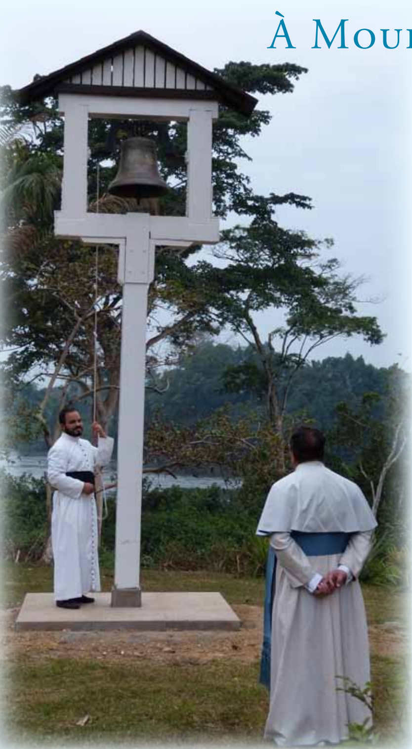
Mgr Wach découvre la nouveau « campanile ».

En août dernier, Mgr Wach a pu visiter notre apostolat de Mouila et découvrir tous les travaux entrepris depuis le début de l'année. A cette occasion, il a béni et inauguré la nouvelle chapelle par la célébration d'une Messe solennelle, en présence des autorités locales et de nombreux fidèles.